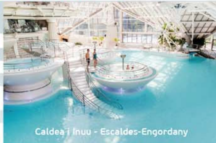
Caldea i Inuu - Escaldes-Engordany

Réservation offres de forfait minimum 48 h avant votre arrivée