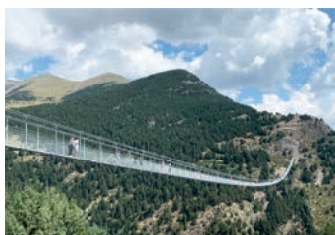
Pont Tibetà Canillo / Pont tibétain - 600 m

+ de 30 jours - 70 € de frais de 30 j à 7 jours 50% du séjour moins de 7 jours 100 % du séjour